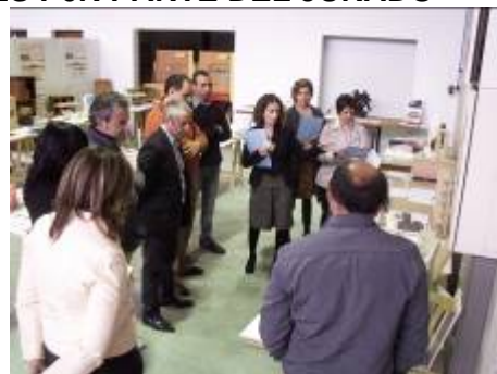
IMAGEN DE LA RUEDA DE PRENSA DE COMUNICACIÓN VEREDICTO JURADO